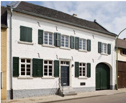
Pos. 7 Die Synagoge Öffnungszeiten beachten !