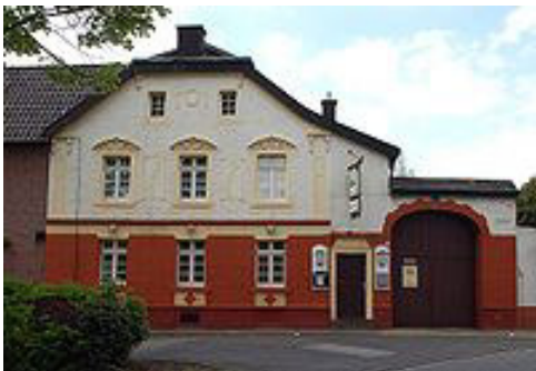
Pos. 9 ehem. Gaststätte „ Zum Kapellchen “ Öffnungszeiten beachten !

Einige Sehenswürdigkeiten zum Betrachten beim gemütlichen Wandern oder Walken ... Gestartet werden kann überall und zu jeder Zeit.