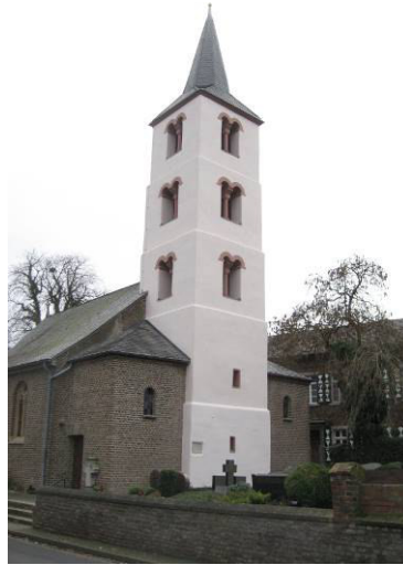
Pos. 1 St. Pakratius Bettenhoven , Bettenhoven ist eine sehr alte Pfarre mit reicher Geschichte am Rande der Kreisgrenze von Düren und Bergheim. Zum Pfarrsprengel gehörten ursprünglich Kalrath, die Paffenlicher- und die Rödinger-Mühle, sowie der Hof Palmesholz. Öffnungszeiten beachten!