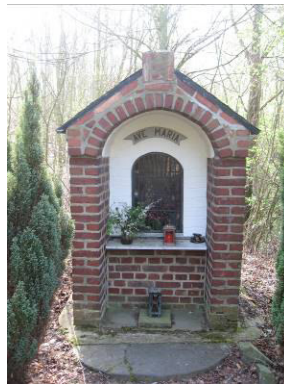
Pos. 18 Marienskapellen am Fuße der Sophienhöhe