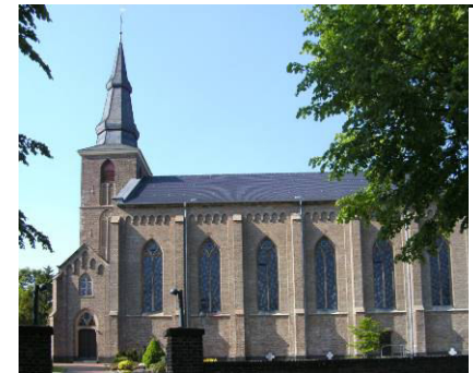
Pos. 12 St. Kornelius Rödinger , weitere Informationen befinden sich in der Kirche Öffnungszeiten beachten!

Der Heimat entsproß unser Leben, ihr gilt unser härtestes Mühen, unser heiligstes Denken und Streben, unsres Herzens letztes Erglänzen. Seit 2016