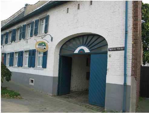
Pos. 11 Die Alte Weberei , Öffnungszeiten beachten !