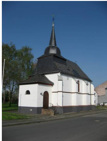
Pos. 16 Die St. Katharina-Kapelle wird erstmals 1405 urkundlich erwähnt, obwohl als Baujahr 1305 angegeben wird. In der Urkunde wird sie gleichzeitig mit einem Hospital und einem Gasthaus genannt, welche früher Pilgern als Bewirtungs- und Pflegestätte diente. 1959 legte man eine wertvolle Deckenmalerei aus dem 16. Jahrhundert frei. Öffnungszeiten beachten!