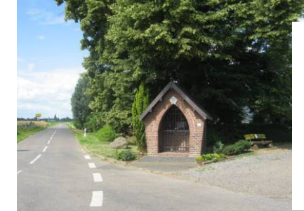
Pos. 14 Kapelle im Klasend am Ortsausgang nach Güsten. Erbaut 1945 von Fam. Wirtz