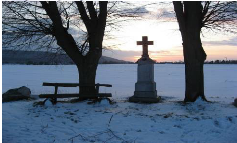
Pos. 5, das Mühlenkreuz mit Blick auf die Sophienhöhe, Palmesholz und den Kraftwerken...